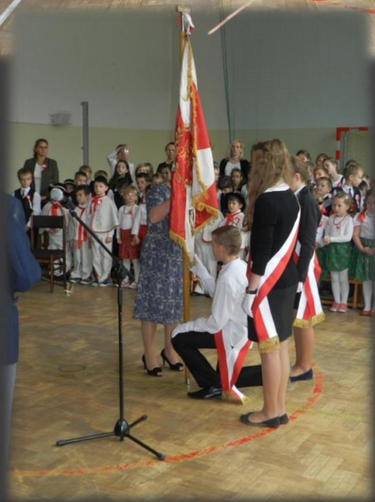
Przekazanie sztandaru ŚZŻAK Oddział Myślenice – 2013 r.