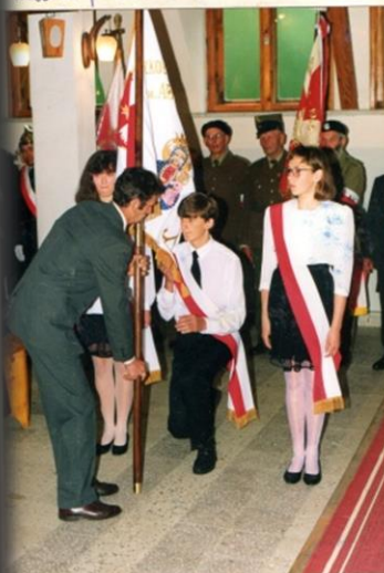
- oto rodzice wręczają sztandar młodzieży...