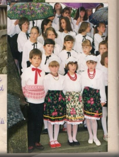
... w tak wrocytej chwili nawet deszcz nas nie przestraszył...