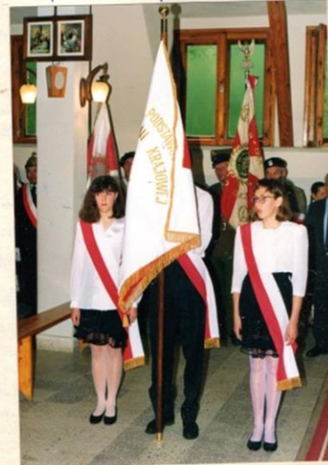
- dotychczasowy zarządcy - mamy sztandar naszej szkoły