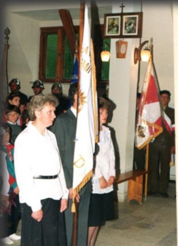
chwila zadumy nadzicich, bo trzeba przekazac sztandar szermom...