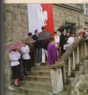
... mimo padającego deszczu wrocytosi odbyły się przed szkołą.....