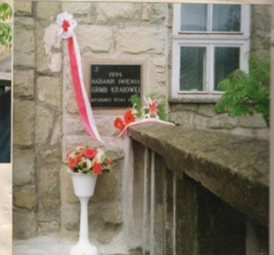
... pozostaje to chwila i pamiątka na wszystkie lata...